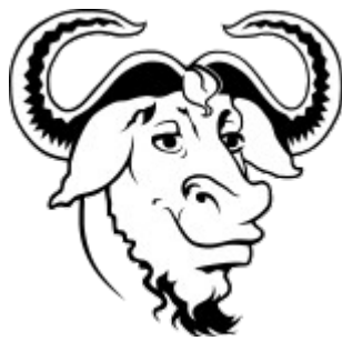
Icono de GNU