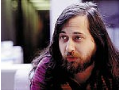
Richard Matthew Stallman