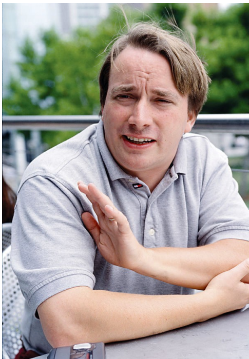
Linus Benedict Torvalds